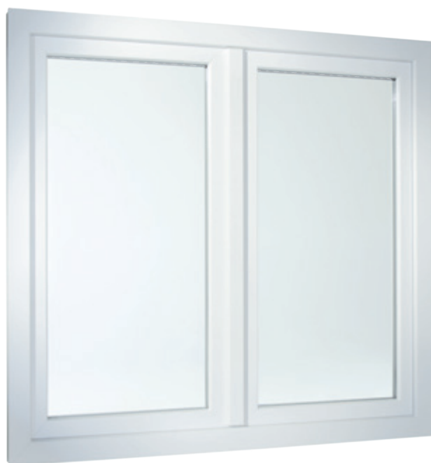
Dvoukřídlové okno s plošně odsazeným křídlem.

Také jeho technické vlastnosti jsou přesvědčivé. Vícekomorové profily využívají izolační vlastnosti vzduchu a splňují tak nejvyšší požadavky na zateplení. Nezajišťují pouze příjemné klima v místnosti za každého počasí, ale i především v zimě pomáhají také značně snížit náklady na vytápění.